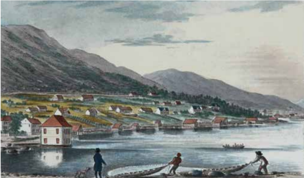
Sildefiske ved Solheimsvika i Masfjorden.