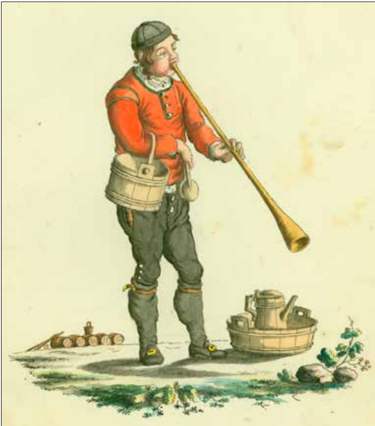
Bonde fra Bergen med lur.

Sammen med instrumentene kom det også noter. Selv om navnene på musikkstykkene ikke er notert i tollistene, kan vi anta at det var stykker som populære i de store europeiske hovedstedene på den tiden. Med noter kunne musikken spres og spilles, slik at folk i hele Norge kunne oppleve den. Mye ble spilt privat, men i de største byene ble det også avholdt åpne konserter slik at alle kunne høre.