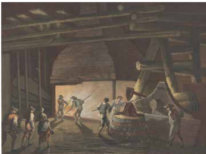
Et norsk ikke navngitt smelteverk fra 1792.

På stadig flere av de store gårdene ble det utover 1700-tallet vanlig med gårds klokke. Den ringte for å signalisere starten og slutten på arbeidsdagen, og for måltider. Tidligere hadde det ikke vært noen måte for gårdsfolket å vite nøyaktig når de skulle være på plass. Med gårds klokken ble arbeidsdagen strukturert, og ikke minst regulert etter storbondens ønsker. De som hadde råd, kunne også kjøpe egne stueur eller lommeur. Disse måtte trekkes opp, men så fulgte tikkingen, og eventuelt time-slagene, resten av dagen. Man kunne rett og slett høre at tiden gikk.