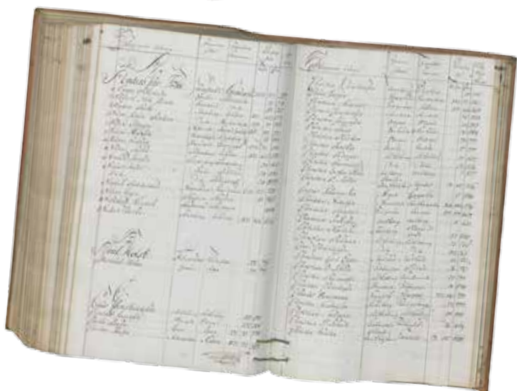
Øverst: Summarisk vareliste for Flekkefjord, 1733. Nederst: Skipsanløpsliste fra Christiania, 1786.