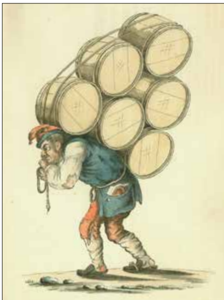
Hardt arbeid var normen.

vi dette tydelig ved at det ikke kom skip til mange av de norske havene fra november/desember til mars. Noen steder enda lengre. Til noen steder, slik som Oslo, kom skipene rett og slett ikke inn fordi fjordene var frosset. Andre steder gjorde vinterstormene at sjøveis handel rett og slett var for farlig.