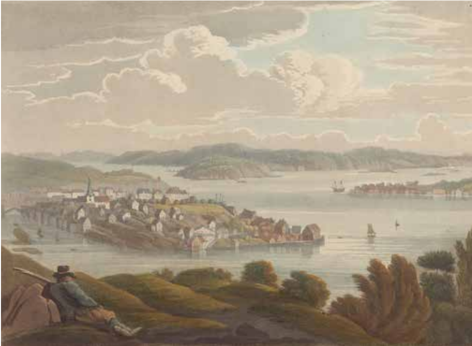
Utsikt over Arendal.