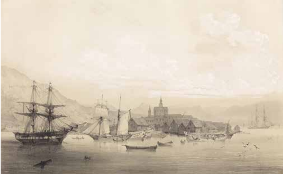
Havnen i Hammerfest.