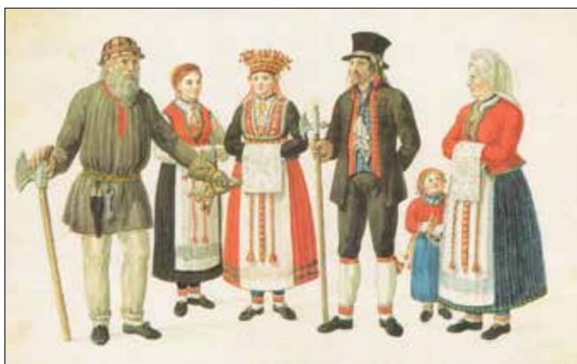
Fargerike drakter fra Hardanger.

Også klærne endret seg. De ble mer fargerike. På starten av århundret var det sort, rødt og brunt som dominerte i fargeinnførselen. Fra 1750-tallet kom det nærmest en eksplosjon av farger, både målt i mengde og i variasjon. Blått, grønt, gult og rosa var ikke uvanlig. Fra museenes draktsamlinger ser vi at folk i siste halvdel av 1700- var særlig glade i å sette sammen mønstrete og spraglete tøyer. Gjerne i sterke farger, og i kombinasjoner som nok er litt fremmede for oss i dag.