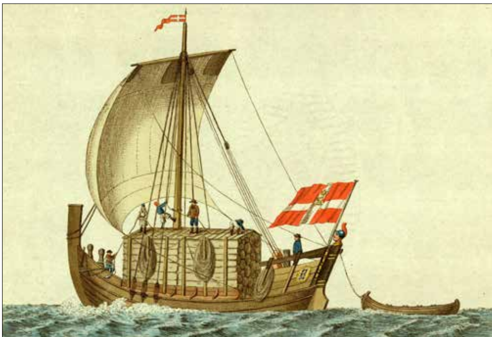
En jekt lastet med tømmer.

De norske eksportvarene var viktige i markedene de kom til. I Storbritannia utgjorde det norske tømmeret 80% av det sivile markedet for tømmer på slutten av 1700-tallet. Norsk fisk var et viktig bidrag til matforsyningen i Sør-Europa, særlig for vanlige folk og fattige. Kobberet fra Trondheim ble også en del av det internasjonale kobbermarkedet. Det ble gjort om til gryter, takdekke, pyntegjenstander og våpen, som ble solgt over hele verden.