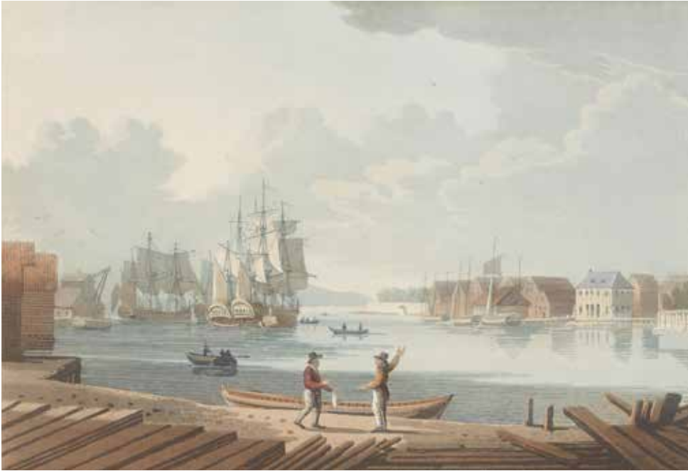
Christiania havn med planker i forgrunnen.