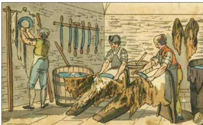
Garving, et illeluktende arbeid.

Da man slapp den evige, sotete røyken som satte seg i alt, ble det også vits i å vaske oftere. I innførselslistene er det en klar økning i såpeimporten, særlig i den siste delen av 1700-tallet. Det var både hvit såpe til klesvask, grønnsåpe til husvask, og duftsåper til kroppen. Vasking av kroppen kom gradvis sent 1700-tallet, og vitnet om en ny kroppshygiene.