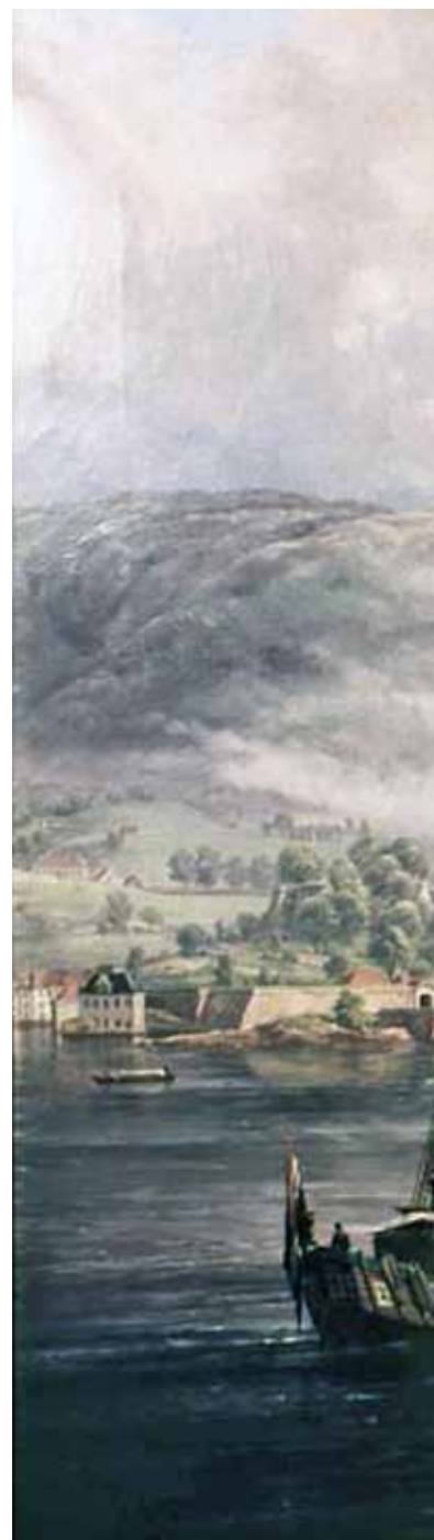
HANDELSBYEN BERGEN. Varelistene viser at vestlandsbyen var den største kjøpstaden i Norge på 1700-tallet.

Norge eksporterte fisk, tømmer, jern, kobber og skinnvarer. I retur kom det nødvendighetsarti-